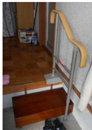
玄関の踏み台と手すり