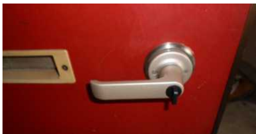
玄関ドアのノブを開けやすいものに交換