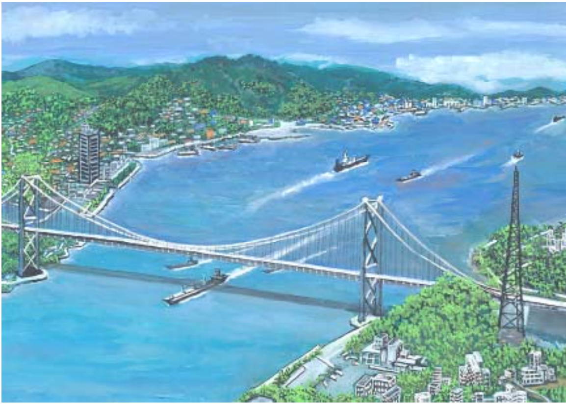
北九州市と下関市とを結ぶ関門海峡の絵です